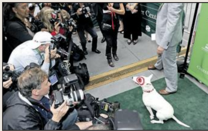
GRØNN AUKSJON: Maskoten "The Target Dog" tar imot deltagerne på torsdagens "Grønne Auksjon" hos Christie's i New York.