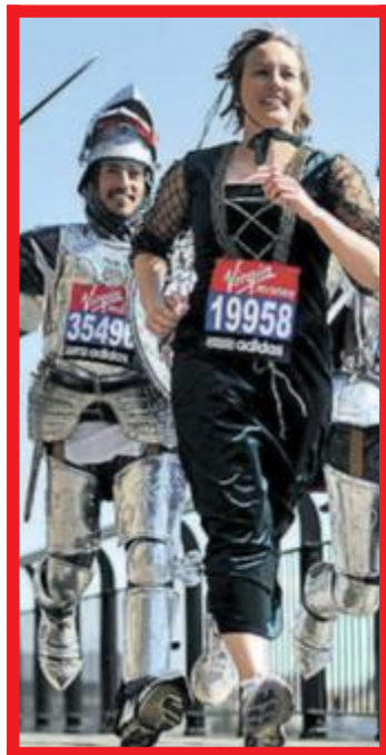
RIDDERE: Deltagere i London Maraton viser frem sine flotte middelalderkostymer. Løpet er i morgen.